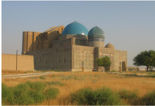
مزار خواجه احمد یسوی، ترکستان، ۷۹۹ق