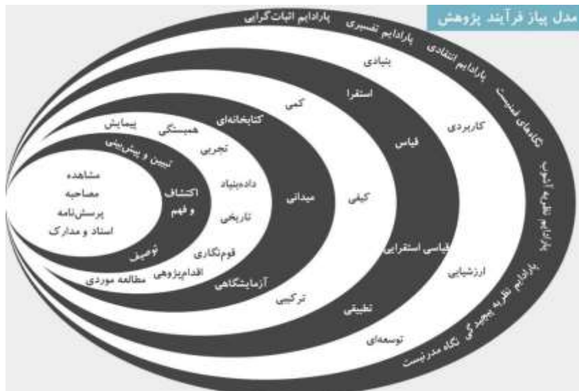
شکل ۱. لایه‌های پژوهش ساندرز

شکل ذیل به نمایش لایه‌های پژوهش بر اساس مدل ساندرز پرداخته است. در این مدل، روش شناسی پژوهش از لایه پارادایمی تا ابزار گردآوری داده‌ها مورد بررسی قرار می‌گیرد.