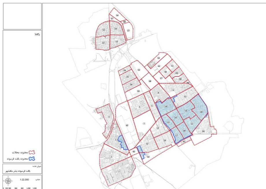
شکل ۳: وضعیت بافت فرسوده محلات شهری بندر ماهشهر