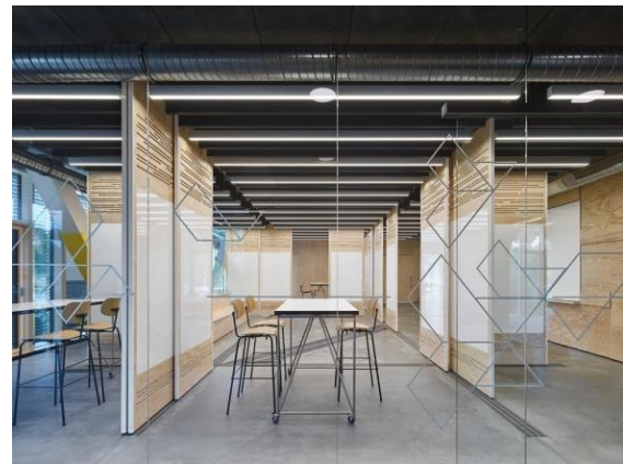
شکل شماره ۶) نمونه‌ای از فضاهای منعطف (گروه معماری پرکینز و ویل ۳، ۲۰۱۶)

رسیدن به این فضاها می‌کند. هدف از طراحی این فضاها، استفاده افراد از محیطی بسته هم به عنوان محلی برای تفکر فردی و نیز با تغییر جزیی محلی برای ملاقات و هم اندیشی است. برای در اختیار گذاشتن محلی برای نوشتن و پیاده کردن ایده‌ها بر روی آن، در طراحی بدنه این فضاها بیشتر از شیشه استفاده می‌شود. (شکل شماره ۶) نمونه ای از فضاهای منعطف نشان داده شده است.