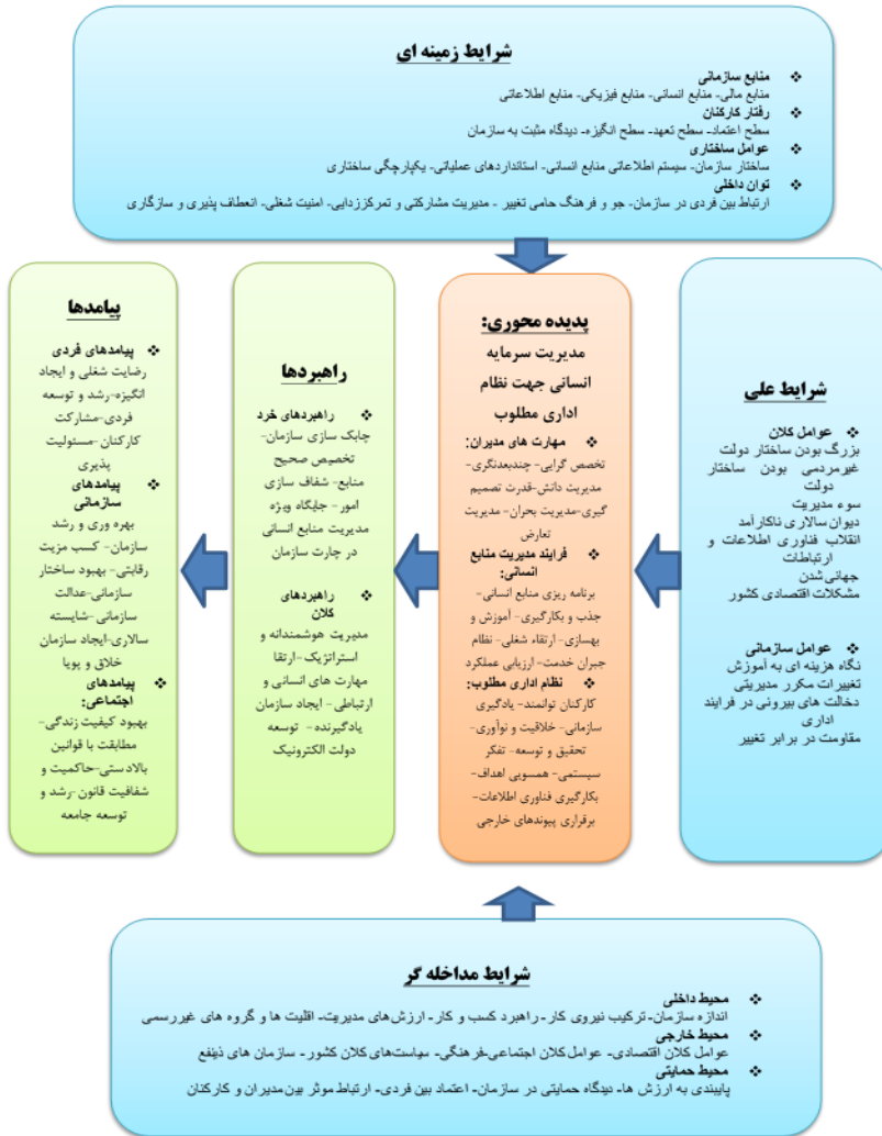
شکل ۱: الگوی پارادایمی مدیریت سرمایه انسانی در ارتقای نظام اداری

اداری (با ابعاد فرایند مدیریت منابع انسانی، مهارت‌های مدیران و نظام اداری مطلوب) تأثیر می‌گذارند و راهبردهای شناسایی شده شامل راهبردهای خرد و کلان و پیامدهای حاصل از مدیریت سرمایه انسانی در نظام اداری به صورت پیامدهای فردی، سازمانی و اجتماعی می‌باشد.