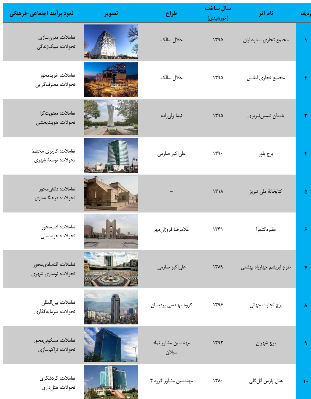
جدول ۲. گستره مطالعه اجتماع موردی از بناهای معاصر تبریز در ارتباط با تعاملات و تحولات اجتماعی-فرهنگی- (مأخذ: یافته‌های پژوهشی)

به منظور بررسی نحوه به کارگیری فرهنگ ساختار در طراحی معماری معاصر تبریز، ۱۰ نمونه از آثار شاخص شهر تبریز جهت مطالعه انتخاب شده برپایه (جدول ۲).