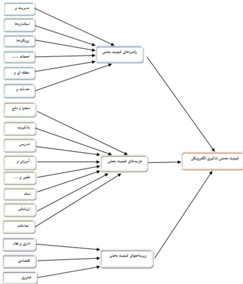
شکل ۱- الگوی پیشنهادی کیفیت بخشی یادگیری الکترونیکی بر اساس راهبردها، فرایندها، و زیرساختهای کیفیت بخشی

در الگوهای PLS دو الگو آزمون می شود. الگوی بیرونی که هم ارز الگوی اندازه گیری و الگوی درونی که هم ارز الگوی ساختاری در الگوهای مبتنی بر کوواریانس می باشد بنابراین نخست الگوی آرایه شده از طریق تحلیل روایی و پایایی بررسی و سپس به وسیله برآورد ضریب مسیر بین متغیرها و تعیین شاخص های برازش الگو آزمون گردید. جهت بررسی