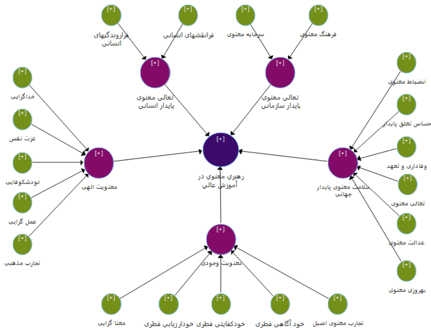
شکل ۲. مدل پایه رهبری معنوی در آموزش عالی

ابعاد و مولفه‌های ساختاری مدل مفهومی تدوین شده رهبری معنوی در آموزش عالی در پژوهش حاضر، ابزاری تحلیلی است که به کمک آن متغیرهای اصلی پژوهش و روابط میان آن‌ها مشخص می‌شود. تقریباً مبنای پژوهش علمی تلقی می‌شود. شکل ۲ مدل پایه مفهومی رهبری معنوی در آموزش عالی مورد مطالعه را نشان داده است: