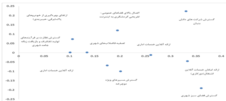
شکل ۲. تاثیرگذاری و تاثیرپذیری عوامل (ترسیم: نگارندگان)

تحلیل سوالات پژوهش: ۱- بر اساس مطالعات تئوریک شناسایی شده است. این محورها شامل ۶ بعد اصلی و ۲۵ انجام گرفته، محوره‌های توسعه شهر تبریز به قرار جدول زیر شاخص است.