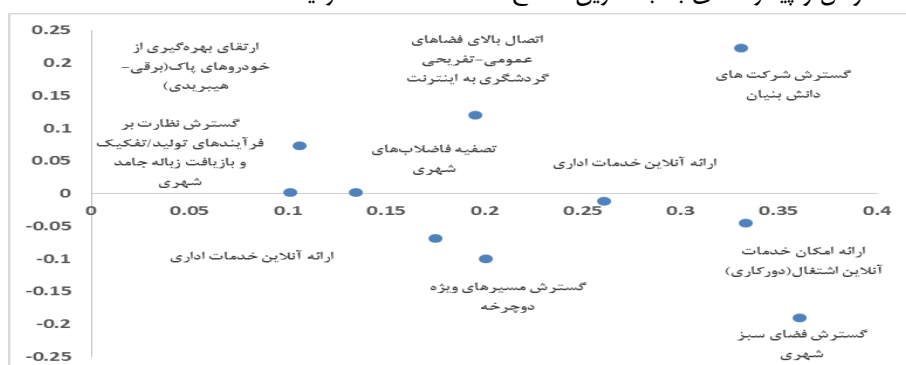
شکل ۳. تاثیرگذاری و تاثیرپذیری عوامل (ترسیم: نگارندگان)

۱- به منظور شناسایی سناریوهای توسعه و گسترش شهر تبریز تلاش شده است، که عوامل و پیشراندهای با بالاترین سطح تاثیرگذاری استفاده گردیده است.