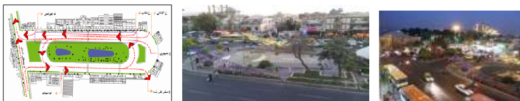
شکل ۲-۱: نقشه میدان بهارستان

پیشینه کالبدی میدان بهارستان، به دوران فتحعلی شاه باز می گردد. بررسی نقشه های موجود نشان می دهد که این میدان از ابتدای شکل گیری دارای فرمی مستطیل شکل بوده است. از میان رفتن باغ های واقع در بدنه های میدان و جایگزینی آنها با ساختمان های مسکونی، اداری، سیاسی و فرهنگی، درختکاری، محوطه سازی و نصب مجسمه (رضا شاه در ۱۳۱۶ و آیتلله مدرس در ۱۳۷۵) از جمله تغییرات کالبدی به وقوع پیوسته در میدان بوده است. بررسی وضعیت مؤلفه های فضایی در میدان بهارستان نشان می دهد