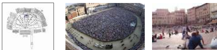
شکل ۱-۴: شکل و نقشه میدان دل کامپو

میدان دل کامپو یکی از بهترین نمونه‌های معماری غیر مذهبی شهر سیه‌نا ایتالیا است که بهترین نقطه گردهمایی و اجتماع مردم است. میدان سیه‌نا همواره مکانی برای تجمع، صحنه‌ای برای نمایش و محلی برای برگزاری جشن‌های ملی و مسابقات پر هیجانی مانند مسابقه اسبدوانی (پالیو) بوده است. از ویژگی‌های موثر میدان در اجتماع شهروندان، شکل نیم دایره و صدف گونه، توپوگرافی منحصر به فرد و فوق العاده،