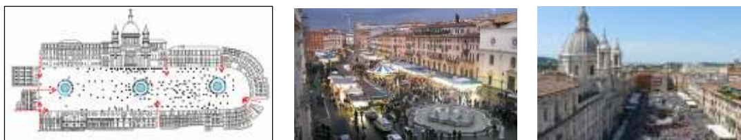
شکل ۱-۳: شکل و نقشه میدان ناوونا

محصوریت بی نظیر، وجود کاخ شهر پابلیکوبا بنای مقرر شکلش در جداره جنوبی، سایه ایجاد شده برج مانیا مانند عقربه یک ساعت آفتابی روی صفحه میدان، نه نوار آجری شعاعی شکل در سنگفرش، وجود آب‌نمای گیاه‌ها در سمت شمال میدان، ممنوعیت ترافیک، نشستن و دراز کشیدن مردم در کف میدان است (کنیرش ۱۳۸۸، ۲۵ تا ۳۴) (شکل ۱-۴).