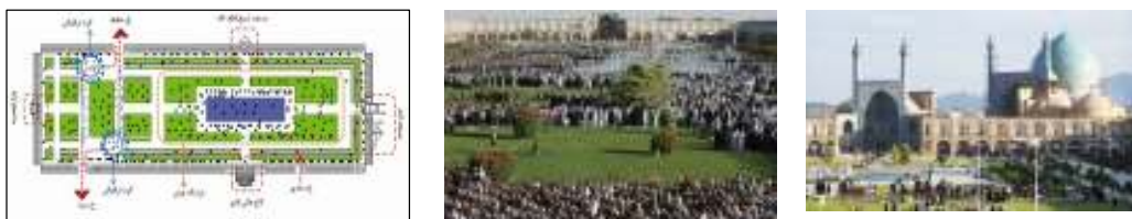
شکل ۱-۱: نقشه میدان نقش جهان

که فرم، نحوه اتصال راه ها به میدان، نبود موانع دید بدنه ها نسبت به یکدیگر، پیوستگی نسبتاً مناسب بدنه ها، وجود مرکزیت قوی به دلیل وجود مجسمه در مرکز میدان و تداوم مناسب بدنه ها باعث شده است که این میدان از لحاظ کالبدی دارای وضعیت مناسبی برای شکل گیری تجمع باشد. کاراکتر میدان بهارستان بیش از هر چیز به عملکرد سیاسی آن وابسته است که از حضور مجلس در میدان ناشی می شود (کیانی ۱۳۷۴، ۶۹۴-۶۹۵) (شکل ۱-۲).