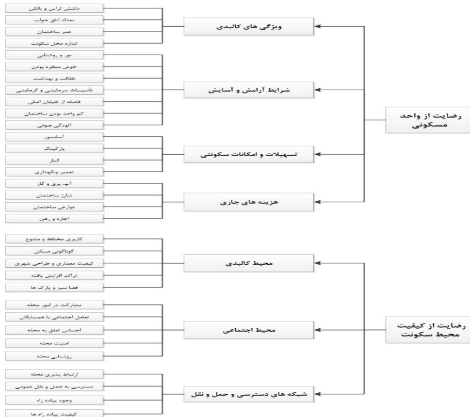
نمودار ۱. مدل مفهومی پژوهش

۴- سنجش میزان رضایت‌مندی اهالی از کیفیت محیط مسکونی و نوع مسکن ۴-۱ میزان رضایت‌مندی بر مبنای آمار توصیفی: با توجه به نتایج جدول شماره ۱، رضایت‌مندی از واحد مسکونی و کیفیت محیط سکونت در محله شهید همتی فر کرمان هر دو بالاتر از سطح متوسط این پژوهش است. ۴-۲ سنجش رضایت‌مندی بر مبنای آمار استنباطی