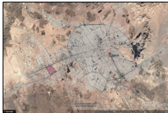
شکل ۱. موقعیت محدوده مورد نظر در شهر کرمان

۲-۱ معنا و مفهوم و تعریف کیفیت محیط: طرح موضوع بهبود و ارتقای کیفیت زندگی و کیفیت محیط شهری، نمود گرایشی نوظهور اوایل دهه ۱۹۶۰ در مواجهه با مسائل رشد و توسعه یک بعدی بود. این گرایش که به منظور پررنگ‌تر کردن جایگاه عوامل اجتماعی-اقتصادی در زندگی انسان‌ها نمایان شد، همراه با سایر مفاهیم نوین اجتماعی مانند رفاه اجتماعی، عدالت اجتماعی و عدالت محیطی در قلمرو برنامه‌ریزی به‌طور اعم و برنامه‌ریزی شهری