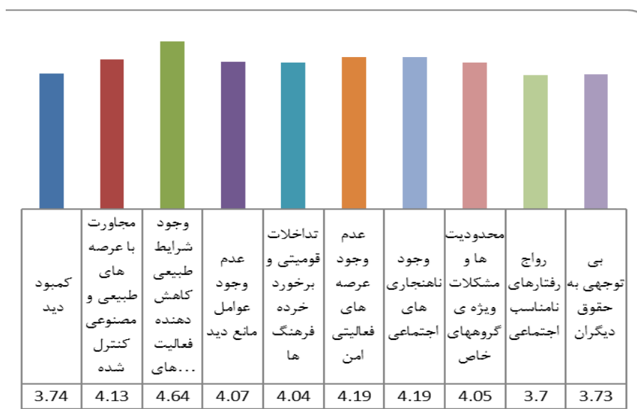
شکل ۳- میانگین رابطه بین عوامل کاهش امنیت پارک‌ها و میزان جرم، منبع: یافته‌های تحقیق، ۱۳۹۴

توجهی به حقوق دیگران) با میانگین ۳/۷۰، کمبود دید (در اثر کمبود نور، عوارض طبیعی، مه‌گرفتگی و ... ) با میانگین ۳/۶۴، بالاترین و پایین‌ترین رتبه را به خود اختصاص داده‌اند.