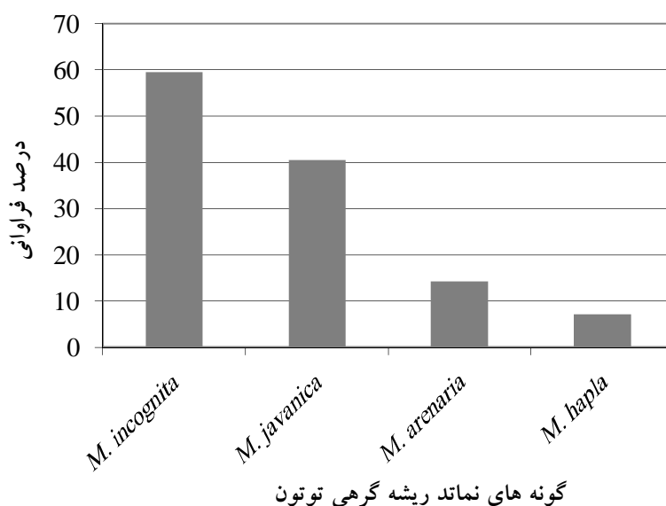
شکل 1- درصد فراوانی گونه‌های مختلف نماتد ریشه گرهی توتون در مناطق بارلی‌کاری توتون در استان مازندران

سه روستای آلوده در نزدیکی و کنار هم قرار دارند که به نظر می‌رسد کانون آلودگی در یکی از این سه روستا بوده و به احتمال زیاد به علت استفاده از ادوات کشاورزی مشترک آلودگی منتقل شده است. با توجه به اینکه 18 روستا آلودگی وجود ندارد رعایت نکات پیشگیری اهمیت بسیار دارد. مشخصات ریخت‌سنجی و ریخت‌شناسی ماده‌ها، نرها و لاروهای سن دوم گونه‌های مختلف نماتد ریشه گرهی در جدول 2 ارائه شده است و واکنش میزبان-های افتراقی به جنس و نژادهای فیزیولوژیکی مختلف نماتد ریشه گرهی در جدول 3 مشخص شده است که بر اساس آن‌ها، 59/52 درصد نمونه‌ها آلوده به نژاد 2 از گونه M. incognita 40/47 درصد دارای گونه M. javanica ، 14/28 درصد حاوی نژاد 2 از گونه M. arenaria و 7/14 درصد آلوده به M. hapla تشخیص داده شده، که با شرح این گونه‌ها توسط جیسون (1978) مطابقت داشتند (شکل 1 و جدول 2).