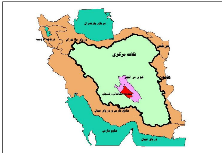
شکل ۱- موقعیت محدوده مطالعاتی رفسنجان در حوزه‌های کویر درانجیر (درجه ۲) و فلات مرکزی (درجه ۱) کشور