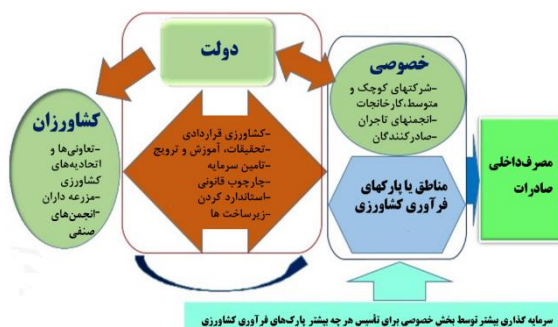
شکل ۲- چگونگی پیوند زنجیره ارزش کشاورزی و مشارکت بخش خصوصی و دولتی

قراردادهای مشارکت عمومی-خصوصی (PPP) ۱ در دنیا عمدتاً مربوط به قراردادهایی است که دولت با بخش صنعت و خدمات انجام می‌دهد. به دلیل متفاوت بودن بخش کشاورزی با سایر بخش‌های اقتصادی دیگر (صنعت و خدمات) که طرف مقابل دولت بخش خصوصی می‌باشد. در بخش کشاورزی دولت با دو گروه سر و کار دارد. گروه اول انبوهی از کشاورزان، باغداران، اتحادیه‌ها و تعاونی‌های تولید محصولات کشاورزی به عنوان تولیدکننده و گروه دوم عوامل بازار در زنجیره ارزش شامل کارگاه‌های بسته‌بندی و صنایع تبدیلی می‌باشند که باید پیوند مناسبی بین آنها ایجاد شود. بنابراین، می‌توان نحوه کارکرد این پیوند را در مشارکت، به صورت یک مدل مشارکت عمومی-خصوصی-کشاورزان (PPFP) ۲ تصور کرد که در شکل ۲ مشخص شده است (۱۷).