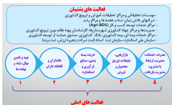
شکل ۵- الگوی تغییر شکل یافته و بومی سازی شده زنجیره ارزش محصولات کشاورزی (باغبانی) بر اساس مدل پورتر (۱)