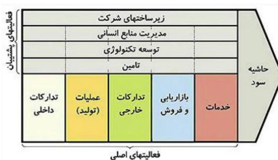
شکل ۴- الگوی زنجیره ارزش پورتر (۱۵)

الگو یا مدل جدید برای ایجاد زنجیره ارزش در تولید محصولات کشاورزی مطابق با الگوی زنجیره ارزش پورتر ۱ می باشد. در الگوی پورتر که در شکل ۴ خلاصه شده است دارای پنج حلقه یا فعالیت اصلی و یک حلقه یا فعالیت پشتیبان می باشد.