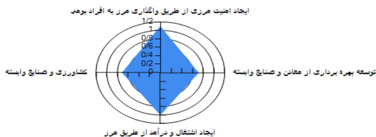
شکل ۳: ایجاد اشتغال و درآمد از طریق مرز

شکل ۲ حاصل جمع‌بندی نهایی پژوهش و نظرات جامعه نمونه و نخبگان در محدوده مورد مطالعه یعنی منطقه مرزی گشت می‌باشد که به عنوان یک الگوی کاربردی برای توسعه پایدار شهر گشت از طریق پژوهش حاضر به دست آمده است.