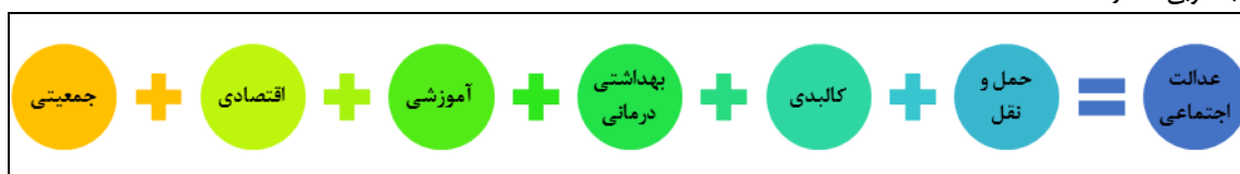
شکل ۱- مؤلفه‌های پژوهش - منبع: نگارندگان، ۱۳۹۷.