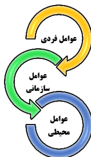
شکل ۱- عوامل مؤثر بر تضعیف اجتماعی (وانگ و همکاران، ۲۰۲۴)

نکته حائز اهمیت آن است که تا به امروز تلاش‌های اندکی برای تبیین عوامل مؤثر بر تضعیف اجتماعی در حرفه حسابرسی صورت گرفته است، و هیچ‌کدام از آن‌ها منجر به تعریف جامع و مورد قبول انجمن‌های حرفه‌ای و قانونی نشده و یا توسط جامعه بین‌الملل به رسمیت شناخته نشده است؛ زیرا تحقیقات انجام گرفته به یک یا چند جنبه خاص از ابعاد شغلی حسابرسان پرداخته‌اند. طاهری‌نیا (۱۴۰۲)، در پژوهشی با عنوان «طراحی مدل آنفولانزای شغلی در حرفه حسابرسی با استفاده از رویکرد ساختاری تفسیری»، نشان داد که، عواملی همچون استرس شغلی، کار بیش از حد، و فشار زمانی عواملی هستند که تعادل شغلی فرد را برهم می‌زنند و به میزان قابل توجهی عملکرد