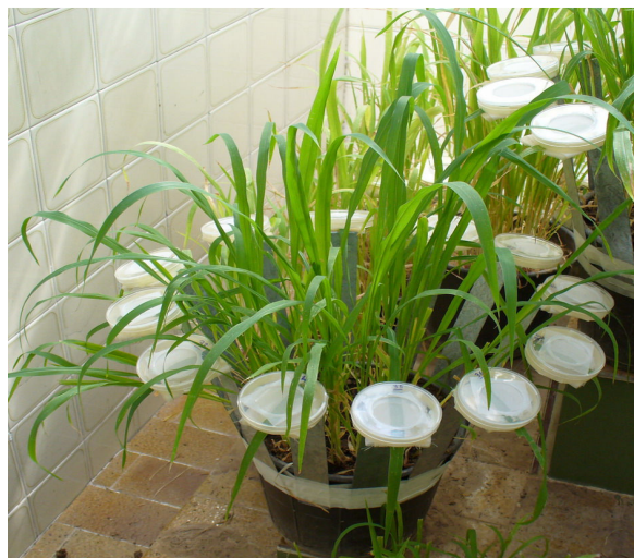
شکل ۱- قفس‌های برگ مورد استفاده در آزمایش زیست‌سنجی

متوات و متاسیستوکس روی شته Lipaphis erysimi بسیار بیشتر از حشره‌کش تماسی مالاتیون بوده است. تقی‌زاده (۱۳۷۵) در بررسی تأثیر چند حشره‌کش روی شته سبز هلو در روی درختان بادام، هلو و بوته‌های فلفل به این نتیجه رسید که پیریمیکارب بهترین شته‌کش مصرفی در تمام مناطق و روی کلیه گیاهان میزبان مورد آزمایش بوده و مالاتیون اثر کنترل‌کنندگی کمتری روی شته سبز هلو در مناطق مورد آزمایش داشت. هم‌چنین مو ۱ و همکاران (۱۹۸۴) مقدار LC50 پیریمیکارب را روی شته سبز هلو ۶/۹ ppm به دست آورده و استفاده از این حشره‌کش در مزرعه ۸۵ درصد جمعیت شته را در مزارع توتون کاهش داد. با این وجود سانگ سئونگ ۲ و همکاران (۱۹۹۳) مقاومت شته سبز سیب را به این حشره‌کش گزارش و LC50 آن را ۱۷۴۵ ppm به دست آورده‌اند. بر اساس نتایج تحقیقات درویش مجنی (۱۳۸۴) ایمیداکلوپراید و متاسیستوکس شرکت بایر آلمان به ترتیب با ۸۸/۷۴ و ۷۸/۱۰ درصد تلفات بیشترین تأثیر را روی شته پنبه، Aphis gossypii داشتند و این در حالی است که درصد تأثیر فرمولاسیون ایرانی دو حشره‌کش مذکور به ترتیب ۲۹/۵۲ و ۴۰ درصد بوده است. نمودار ۱ شاخص پتانسیل نسبی کاهش غلظت حشره‌کش‌های مورد آزمایش را نشان می‌دهد. این شاخص از نسبت غلظت مورد استفاده حشره‌کش در مزرعه به LC50 آن