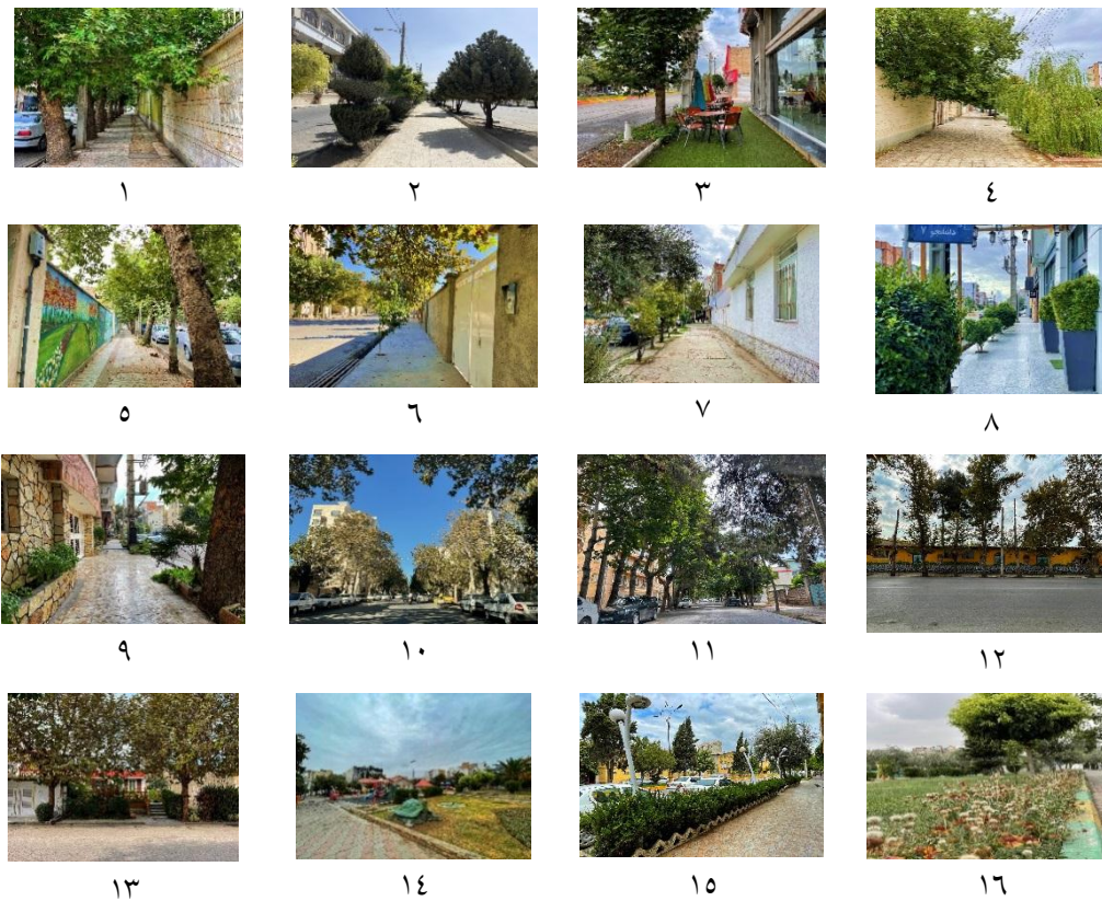
شکل ۴. تصاویر منتخب حاصل از پرسشنامه روش طبقه‌بندی کیفیت بصری و دیدگاه شهروندان