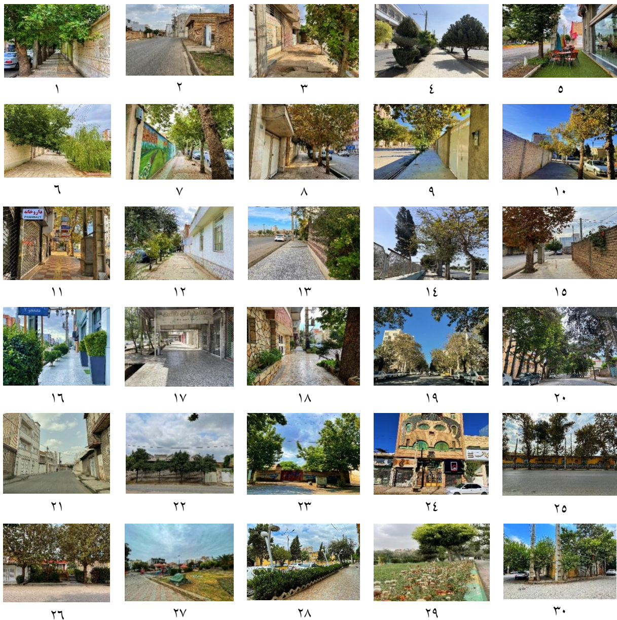
شکل ۳. تصاویر منظر خیابانی شهر گندکاووس

این گام، از روش طبقه‌بندی کیفیت بصری استفاده شد که از طریق آن می‌توان حداکثر استفاده نمود.