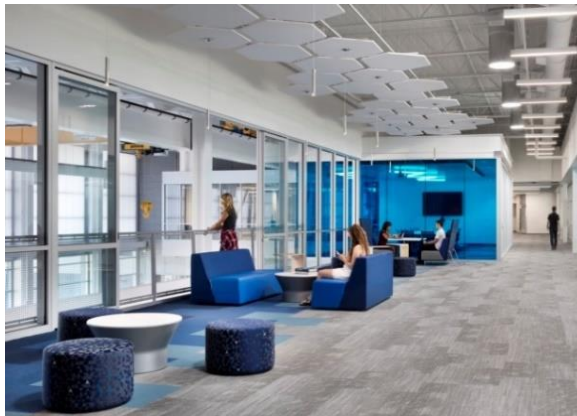
شکل شماره ۵) نمونه‌ای از فضاهای باز عمومی

این فضاها به منظور استفاده جمعی و فردی به صورت هم زمان در نظر گرفته شده اند. به صورتیکه افراد می‌توانند در آن به گفت و گو با یکدیگر پرداخته و یا هر فردی به تنهایی به کار شخصی خود بپردازد. انتخاب مبلمان مناسب در این فضا