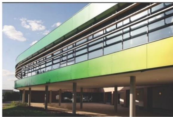
شکل شماره ۳) نمای جنوبی اندیشگاه لینکلن (گروه معماری مارکس بارفیلد، ۲۰۰۸)