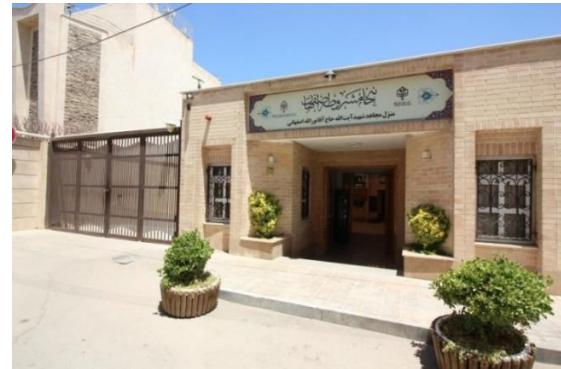
شکل شماره ۱) نمای بیرونی اندیشگاه هویت شناسی و تمدن نوین اسلامی.

اندیشگاه لینکلن به سفارش شورای شهر لینکلن در انگلستان،