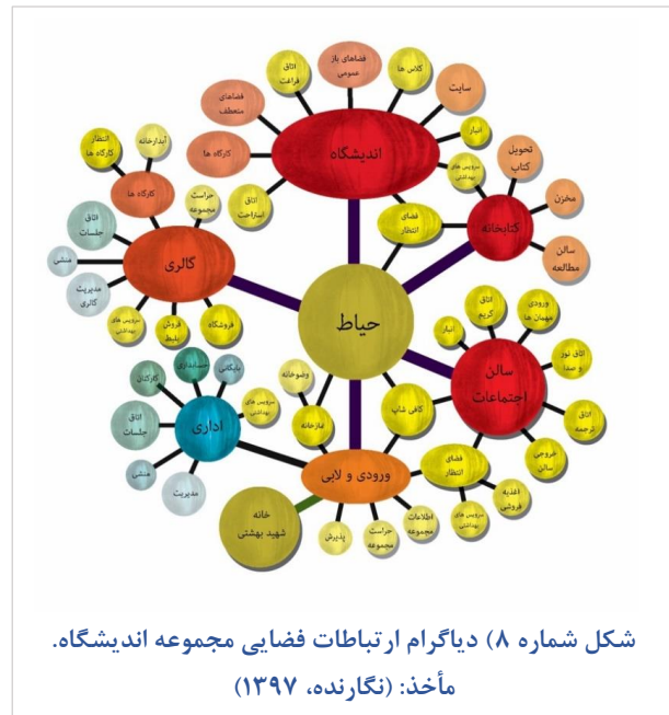
شکل شماره ۸) دیگرام ارتباطات فضایی مجموعه اندیشه‌گاه.

گروه طراحی ترنر (طراحی موسسه رند). www.turnerconstruction.com/experience/project/60/rand-corporate-headquarters . بازیابی شده در تاریخ ۹۵/۵/۲۳.