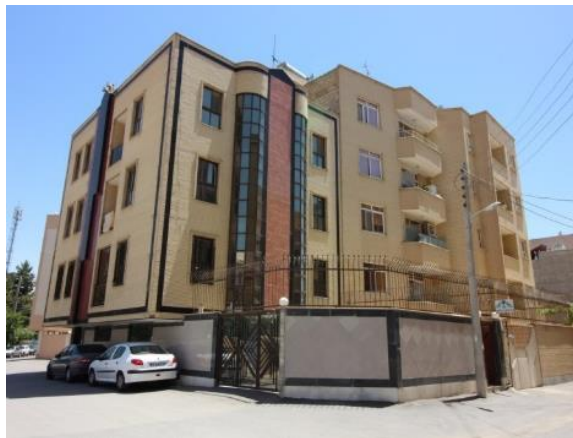
شکل شماره ۲

کل ساختمان این بنا به اندیشگاه اختصاص نیافته است، بلکه تنها بخش زیرزمین به این منظور مورد استفاده قرار گرفته است. معلولین به دلیل وجود پله های زیاد در ورودی بنا قادر به استفاده از آن نیستند. (شکل شماره ۲) محل قرارگیری این اندیشگاه را نمایش می دهد.