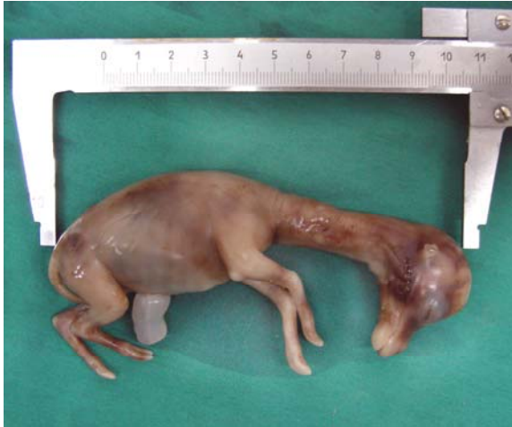
شکل شماره ۱- تعیین سن جنین بر اساس معیار C-RL