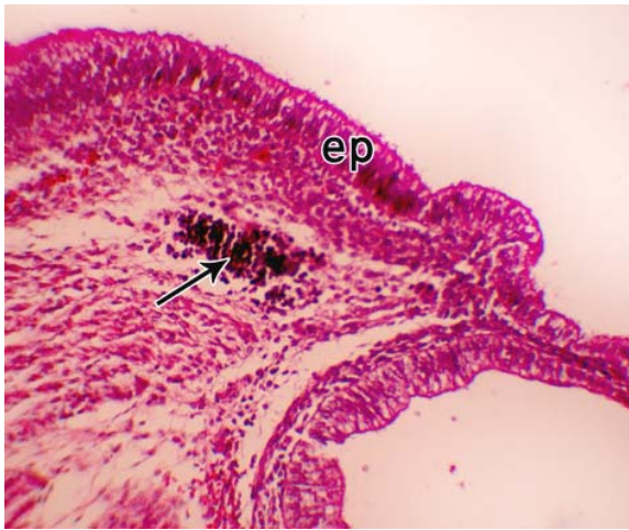
شکل شماره ۲ - جنین با C-RL=30cm ep: اپیتلیوم مخاط، پیکان: ندول لنفاوی بزرگنمایی: ۱۵۰ x