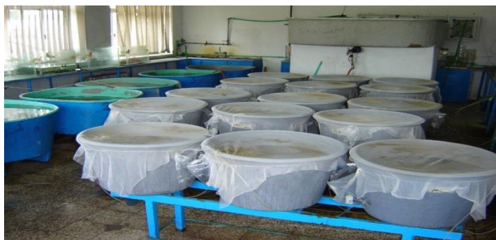
شکل ۱. نمای کلی از سیستم پرورشی بچه ماهیان سفید

آنالیز آماری داده‌ها با استفاده از نرم افزار SPSS و آزمون‌های دانکن و کروسکال - والیس در سطح اطمینان ۰/۹۵ انجام گرفت.