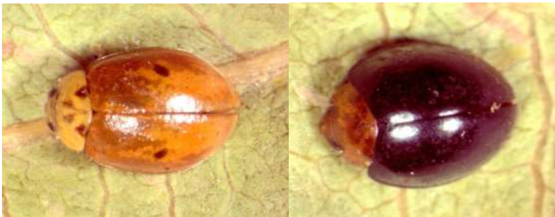
شکل ۴- کفشدوزک دو نقطه‌ای Adalia bipunctata (راست)، کفشدوزک Exochomus nigripennis (چپ)