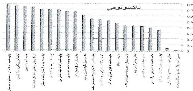
رتبه بندی صنایع کارخانه‌ای ایران با استفاده از روش تاکسونومی