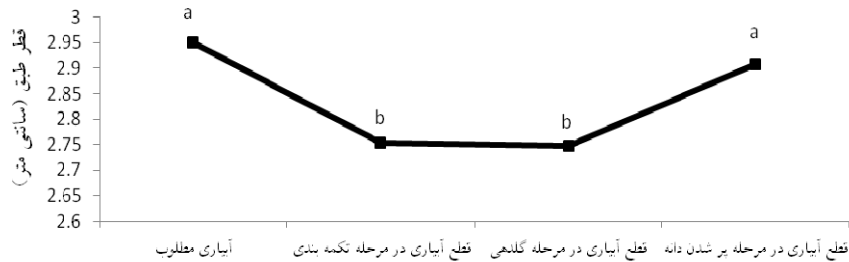
شکل ۲- مقایسه میانگین قطر طبق گلرنگ تحت تاثیر رژیم های مختلف قطع آبیاری

آبیاری ( I_2 ) دیده شد (جدول ۳). کاهش ۲۱/۷۹ درصدی وزن هزار دانه در تیمار ( I_2N ) نسبت به تیمار ( I_1T )، کارایی بهتر در تلفیق کود زیستی با کود نانو و کود شیمیایی تحت آبیاری مطلوب نسبت به کاربرد تنه‌های کود نانو تحت قطع آبیاری در مرحله تکمه‌بندی را نشان می‌دهد که این یافته را می‌توان از طریق کارایی بهتر سیستم‌های تلفیقی در افزایش فعالیت‌های میکروبی و آنزیمی و آزادسازی عناصر غذایی موجود در کلونیدهای خاک نسبت به سایر سیستم‌ها توجیه کرد (مونتومورو، ۲۰۰۹).