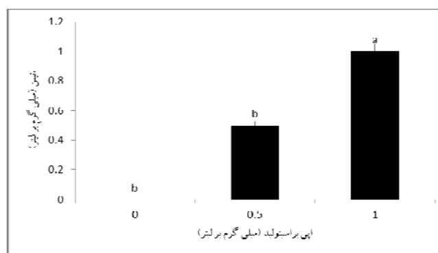
شکل ۱- تأثیر محلول پاشی اپی براسینولید بر میزان اتیلن در مرحله اول محلول پاشی (یک هفته قبل از تمام گل). میانگین هر ستون که دارای حروف مشابه می باشند از نظر آماری تفاوت معنی داری در سطح ۵٪ آزمون چند دامنه‌ای دانکن ندارند. خطوط عمودی روی هر ستون نشان‌دهنده \pm خطای استاندارد

* مرحله ۱ = محلول پاشی یک هفته قبل از تمام گل، مرحله ۲ = محلول پاشی پنج هفته بعد از تمام گل است. ** اعداد شامل میانگین \pm خطای استاندارد می باشد. در هر ستون میانگین‌هایی که دارای حروف مشابه می باشند، در سطح ۵٪ آزمون دانکن اختلاف معنی داری ندارند.