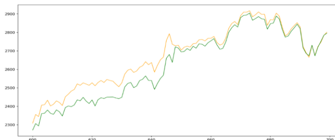
شکل ۴: اسپرد بین دو سهم گوگل و گوگ، موقعیت‌های معاملاتی.