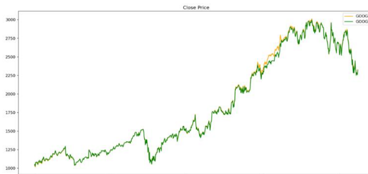
شکل ۳: سری‌های زمانی دو سهم گوگل و گوگ

بسته می‌شود. برای مثال نقاط ۶۰۵ و ۶۱۰ دو موقعیت معاملاتی است همچنین نقاط ۶۱۱ و ۶۲۰ نیز نقاط معاملاتی هستند. در نقطه ۶۲۰ معامله باز می‌شود و در نقطه ۶۳۰ معامله بسته می‌شود. این دو نقطه به عنوان برچسب سودآور شناخته شده و با عدد ۱، TP و بقیه نقاط که اسپرد مناسبی تشکیل نشده مانند ۶۸۰ و ۷۰۰ برچسب بدون سود شناخته شده و با عدد ۰، TN نمایش داده می‌شوند.