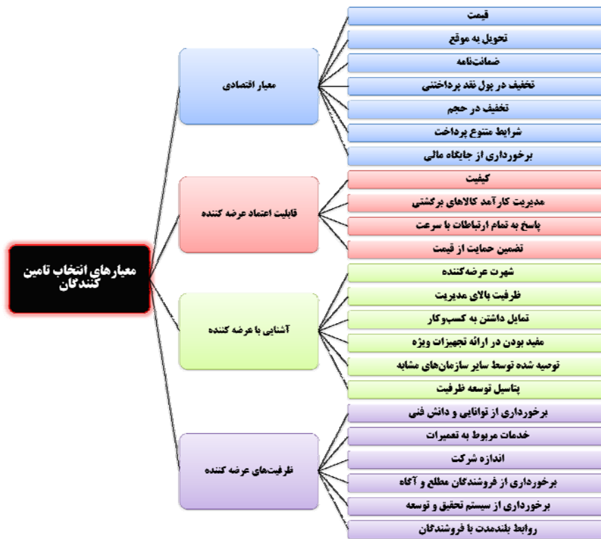
شکل ۱: الگوی مفهومی تحقیق

الگوی مفهومی تحقیق: مدل مفهومی تحقیق در نمودار زیر ارائه شده است: