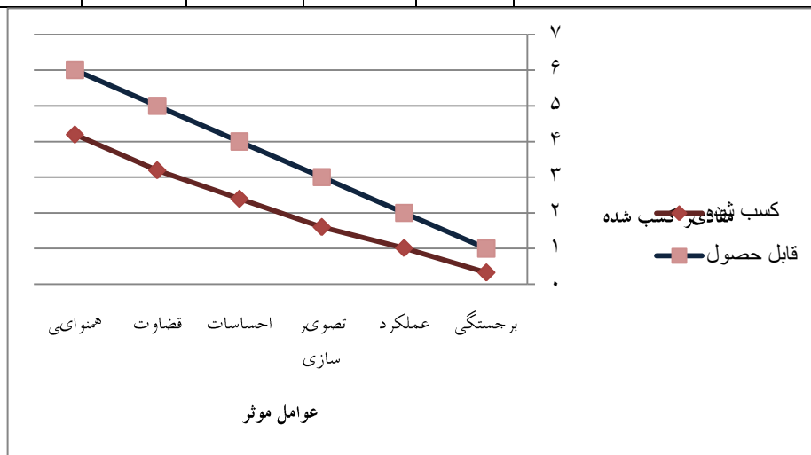
نمودار یک - توزیع رفتاری عوامل موثر