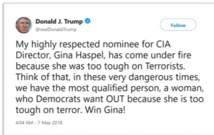
شکل ۳: دفاع سرسختانه ترامپ از هاسپل علیرغم انتقادات فزاینده از او (ترجمه در پاورقی) ۱ :

سوابق بحث انگیز در شکنجه و خشونت، ترامپ با اصرار بر دیدگاه خود از هسپل دفاع کرد.