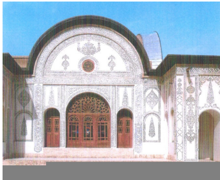
تصویر شماره ی (۴): خانه ی تاریخی طباطبایی ها در کاشان

حکیم باشی؛ ۷- خانه ی تاریخی حاجی سید آقا؛ ۸- خانه ی تاریخی حاجی رضا حاج صالح؛ ۹- خانه ی تاریخی حاجی علی نقی رئیس التجار؛ ۱۰- خانه ی تاریخی عبدالله خان غفاری؛ ۱۱- خانه ی تاریخی معظم السلطنه؛ ۱۲- خانه ی تاریخی میرزا جلال الدین غفاری؛ ۱۳- خانه ی تاریخی حاج محمد مهدی؛ ۱۴- خانه ی تاریخی سید شکری؛ ۱۵- خانه ی تاریخی لاجوردی ها؛ ۱۶- خانه ی تاریخی حاج محمد علی وارثچ؛ ۱۷- خانه ی تاریخی تفضلی ها؛ ۱۸- خانه ی تاریخی حاجی سید محمود هاشمیان؛ ۱۹- خانه ی تاریخی آل یاسین. ۲۰- خانه ی تاریخی آقا کر؛ ۲۱- خانه ی تاریخی صالح؛ ۲۲- خانه ی تاریخی کاشانیان؛ ۲۳- خانه ی تاریخی حکیم باشی؛ ۲۴- خانه ی تاریخی بنی کاظمی.