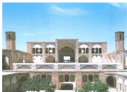
تصویر شماره ی (۳): بخشی از مسجد و مدرسه ی آقا بزرگ در کاشان