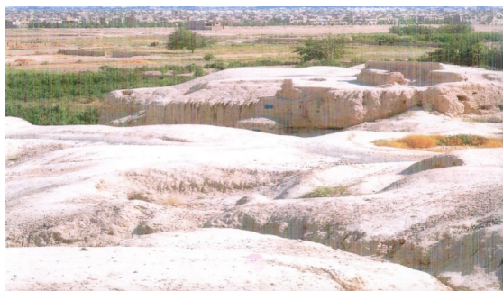
تصویر شماره (۱): بخشی از تپه ی سیلک در کاشان

اسب، سگ، خوک در خانه ها پیدا شده است. در کتاب مرآت قاسان آمده است: یکی از قلعه جات قدیمی (قلعه ی سی ارگ) است و گویند چون خاک آن موضع که مبنای آن قلعه است نسبتاً از خاک اطرافش سفیدتر است، موسوم به سپید ارگ شده و از کثرت استعمال در طول زمان سی ارگ نامیده اند (پورنقی، ۱۳۸۷ ص ۲۴۵).