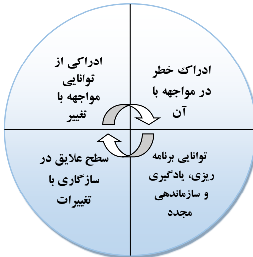
نمودار ۱- چارچوب مفهومی مولفه های تاب آوری اجتماعی

ثباتی وضیت مالی، عدم تامین امنیت شغلی و عدم توانایی در رقابت های صنعتی از جمله عواملی هستند که آسیب پذیری هایی را در جامعه ایجاد می کنند. به کارگیری سیاست ها و برنامه هایی که نحوه مواجهه با این آسیب ها را آموزش دهد قطعاً هزینه های مواجهه با این آسیب ها را کمتر خواهد کرد و باور به جذب و یا مقابله با این آسیب ها تقویت خواهد شد. «توانایی ریزی، یادگیری و سازماندهی مجدد»؛ توانایی برنامه ریزی، یادگیری و سازماندهی مجدد، یک امر ضروری برای مواجهه با تغییرات است و افراد نحوه برخورد با تغییرات و تنش ها را می آموزند. در وضعیت «ادراکی از توانایی مواجهه با تغییر»؛ مردم برای مقابله با تغییرات در شرایط مختلف زندگی اعم از مالی، عاطفی و زناشویی، باید آستانه تحمل خود را بالا ببرند. به عنوان نمونه در رابطه زناشویی در مواجهه با بحران ها و تنش های ناشی شده از تغییرات و حوادث، نیاز است که توانایی تحمل تغییر افراد بالاتر باشد تا زندگی دوام داشته باشد. در نهایت در وضعیت مولفه «سطح علایق در سازگاری با تغییرات»؛ افرادی که تمایل بیشتری به سازگاری و تطبیق دارند نسبت به تغییر سیاست ها راحت تر برخورد می کنند. به عنوان نمونه در بحث های مربوط به خانواده سازگاری و تطبیق معمولاً در زمینه های وابستگی های شغلی، تعهدات خانوادگی و یا مباحث مالی اتفاق می افتد. افرادی که طلاق گرفته اند در مواجهه با تغییراتی که در کسب درآمد و فرصت های شغلی برایشان اتفاق می افتد، تاب آوری بیشتری دارند (رفعیان و همکاران، ۱۳۹۰: ۲۰).