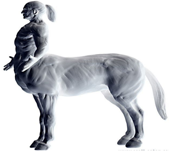
تصویر شماره 1

به آنیما (یعنی بخش زنانه وجود مردان) تمایل دارد.