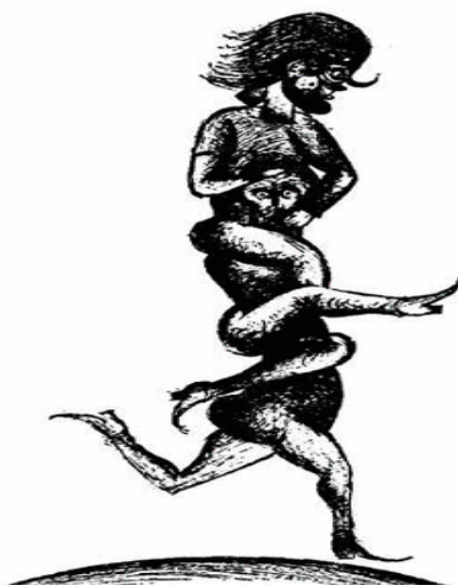
تصویر شماره 4

این موجود افسانه‌ای در چند حکایت از مجموعه حکایات هزار و یک شب از جمله در "سفر پنجم سندباد" به صورت موجودی با پایایی که خاصیت تازیانه دارد و مانند چرم گاومیش است، ظاهر می‌شود، که به آن