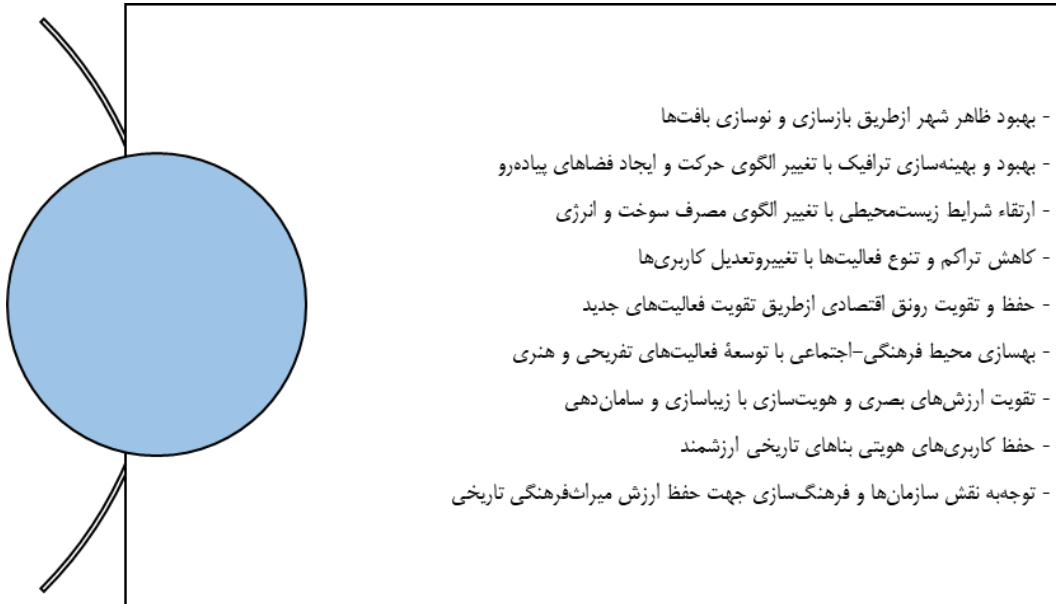
شکل ۱- اهداف پایه در برنامه‌ریزی در تبیین مرمت شهری- (مأخذ: برداشت از مجموعه آثار معمار دبدبه، ۱۴۰۰)

برنامه‌ریزی شهری فرایند سازمان‌دهی و تنظیم فضاها، ساختارها و خدمات شهری به منظور بهبود کیفیت زندگی شهروندان است. ارکان اصلی برنامه‌ریزی شهری شامل زیرساخت‌های فیزیکی، اقتصادی، اجتماعی، محیط‌زیستی دیگر موارد می‌باشند. مهمترین اهداف برنامه‌ریزی شهری در تبیین مرمت شهری، باتوجه به تعداد و تنوع مسائل مرکز شهر، باید براساس محورهای برپایه (شکل ۱)، موردواکاوی و ارزیابی قرار گیرد.