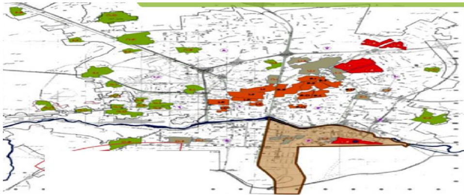
شکل ۳: موقعیت محله همت در منطقه ۶ شهرداری اصفهان