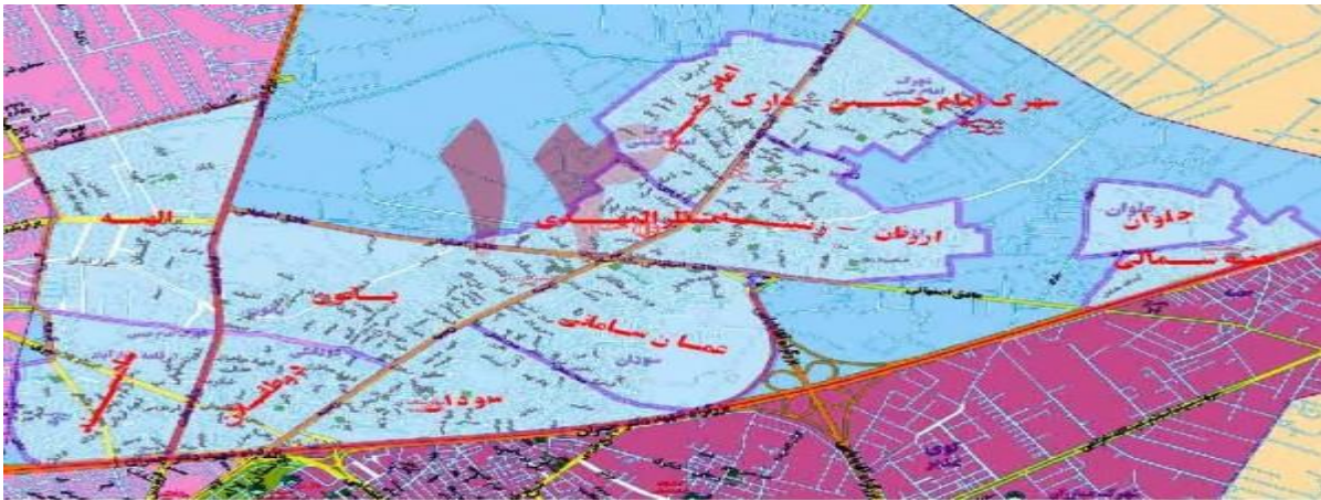
شکل ۲: موقعیت محله زینبیه در منطقه ۱۴ شهرداری اصفهان