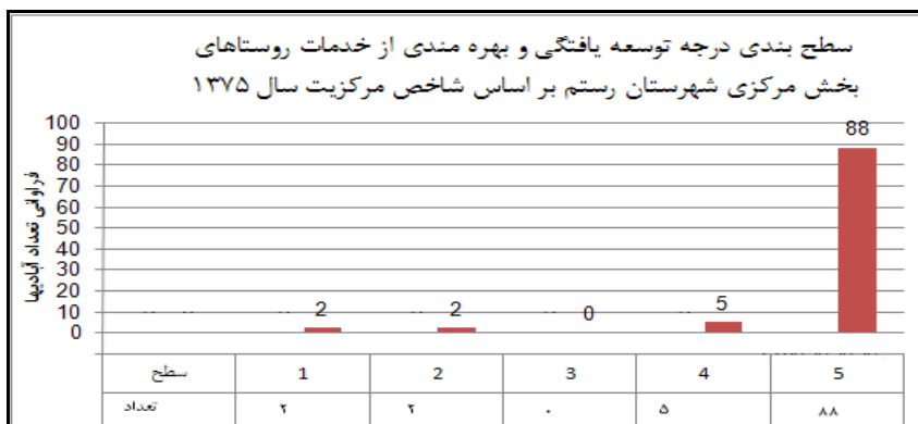
شکل ۲. سطح بندی خدمات در روستاهای بخش مرکزی شهرستان رستم بر اساس مدل شاخص مرکزیت (۱۳۷۵)

بر پایه شاخص سطح بندی، روستاهای بخش در سال ۱۳۸۵ نظم سلسله مراتب تمرکز گرایانه‌ای وجود داشته است. به طوری که در سطوح یک و دو به ترتیب: ۱ و ۲ روستای برخوردار وجود داشته است. در سطح سه همچون دهه قبل هیچ روستایی وجود ندارد و در سطح چهارم ۴ آبادی و در آخرین سطح از طبقه بندی، ۸۳ روستا معادل با ۹۲ درصد از روستاهای مورد مطالعه قرار گرفته‌اند (جدول ۸ و شکل ۳). در این دهه که بعد از تبدیل مصیری به شهر مورد بررسی قرار گرفته نه تنها نظم قبلی از لحاظ برخورداری میان آبادی‌ها تکرار شده است؛ بلکه باز هم اکثریت روستاهای بخش غیربرخوردار و توسعه نیافته قلمداد شده‌اند. این موضوع ناکارآمدی و ضعف در عملکرد خدمات رسانی شهر را می‌رساند.