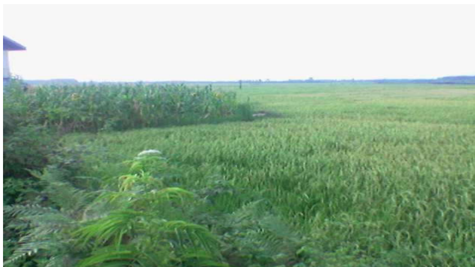
تصویر ۴. مزارع زیبای برنج در روستای جای بیجار یکی از قابلیت های گردشگری

بسیار زیبایی، برنگ زرد تمام باغ را می پوشاند تجسم خاصی برای جذب گردشگران می شود. کلزا در روستاهای آبکنار، بشمن، رودپشت، سنگاجین، خمیران، علی آباد، کرگان و کپورچال موجود است و علاوه بر آن هندوانه و توتستان (برای پرورش کرم ابریشم) در روستاهای تربگوده و طالب آباد نیز کشت می گردد (تصویر شماره ۴).