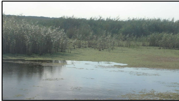
شکل ۲. نمایی از پارک خشکی دریایی بوجاق کیشهر (گیلان)

اساس قانون حفاظت و بهسازی محیط به منظور تأمین امنیت زیستگاهی و بهبود شرایط زیستی به مدت ۵ سال با نام منطقه شکار ممنوع بوجاق زیر نظر سازمان حفاظت محیط زیست قرار گرفت. در سال ۱۳۸۱ منطقه‌ای مشتمل به دهانه سفیدرود، تالاب بوجاق در شرق و لاگون درکیاشهر در غرب آن به انضمام بخش‌هایی از پهنه‌های آبی دریای خزر به مساحت ۳۲۶۶/۸۳ هکتار به عنوان پارک ملی خشکی-دریایی بوجاق مورد تصویب قرار گرفت. از نظر وضعیت ظاهری به شکل‌های مرتعی، تالابی و ساحلی می‌باشد. این منطقه تالاب ساحلی دریایی با آب شیرین تا لب شور همراه اراضی جنگلی پوشیده از گیاهان مرتعی و کنار آبرزی است و محل زمستان‌گذرانی حدود ۵۰ نوع از پرندگان مهاجر آبرزی و جوجه‌آوری پرندگان بومی آبرزی است حضور چشم‌گیر انواع پرندگان، چشم‌اندازهای زیبا، آب و هوای متنوع، نزدیکی به مراکز جمعیت و راه دسترسی مناسب پتانسیل‌های اکوتوریستی قابل توجهی است (شکل ۲).