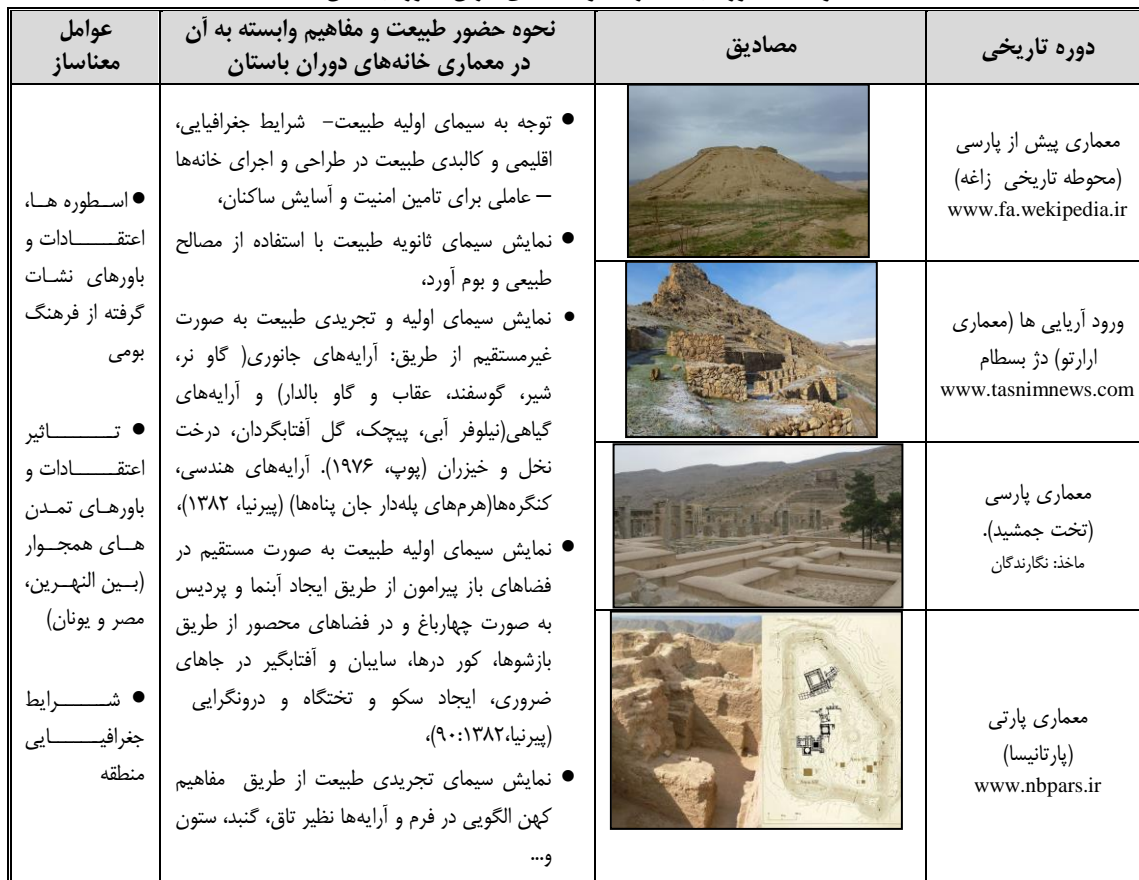
جدول ۳. حضور طبیعت در سکونتگاه‌های ایران - دوره باستان