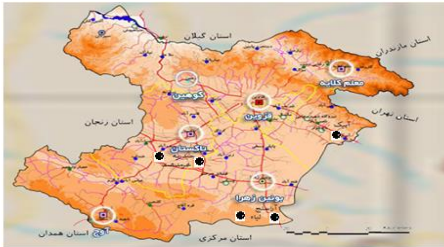
شکل ۲. موقعیت جغرافیایی محدوده مورد مطالعه تحقیق