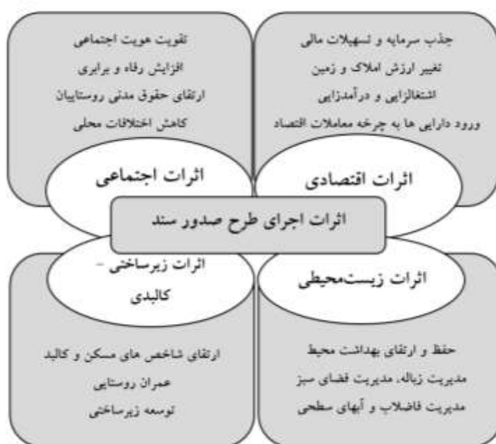
شکل ۱. اثرات و اهداف طرح صدور سند

از سویی براساس تعاریف و مطالعات بسیار صورت گرفته در این راستا، زیست‌پذیری منعکس‌کننده رفاه یک اجتماع محلی است و مشتمل بر بسیاری از خصوصیتی است که یک مکان را تبدیل به جایی می‌کند که مردم تمایل به زندگی در آن‌جا در زمان حال و آینده دارند (Victorian Competition & Efficiency Commission, 2008).