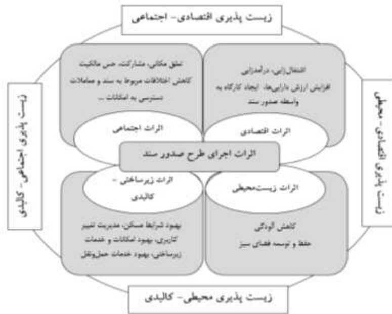
شکل ۲. مدل تحلیلی تحقیق، نقش طرح صدور سند بر زیست‌پذیری سکونتگاه‌های روستایی

دهستان زبرخان شهرستان نیشابور از زمره مناطق است که در سال‌های اخیر، شاهد اجرای طرح صدور سند برای نواحی روستایی بوده است. مطالعه حاضر به دنبال بررسی این موضوع است که اجرای طرح صدور سند تا چه اندازه بر ارتقای زیست‌پذیری نواحی روستایی، نقش داشته است. بر این اساس می‌توان سؤال کلیدی تحقیق را به شرح زیر بیان نمود: طرح صدور اسناد روستایی تا چه میزان بر زیست‌پذیری سکونت‌گاه‌های روستایی نقش داشته است؟ در خصوص اثرات اجرای طرح صدور سند و زیست‌پذیری به صورت مجزا تحقیقات بسیاری صورت گرفته که این دو متغیر را از ابعاد مختلف مورد بررسی قرار داده‌اند و در ادامه به برخی از آن‌ها اشاره می‌شود. اما مطالعه ای که به بررسی ارتباط و تاثیرگذاری این دو متغیر بر یکدیگر اشاره و متمرکز باشد، یافت نشد.