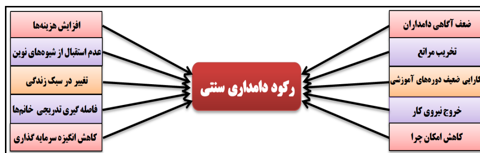
شکل ۱. موارد مورد بررسی بر رکود دامداری سنتی در دو ناحیه مورد مطالعه

تمایل غیر منطقی به افزایش دام اهلی خوددارند. دلیل اصلی این امر تمایل به افزایش درآمد حاصل از دامداری بدون توجه به وضعیت مراتع است اما در مواردی این بی‌توجهی منجر به رکود آن می‌گردد. پاربخ ۱ و همکاران (۱۹۹۷) نشان دادند که نوسانات آب و هوایی همراه با افزایش میزان نرخ دام‌گذاری به شدت افت درآمد را افزایش می‌دهد. درآمد پایین در چرخه‌ی تولید دام به استرس برای تولیدکنندگان کشاورزی و خانواده‌های آن‌ها که با افزایش فشارهای مالی و احتمال شکست در کسب و کار روبرو هستند منجر می‌شود. نگلر ۲ و همکاران (۲۰۰۷) علاوه بر استراتژی‌های انحلال جزئی گله و خرید اضافی علوفه، استراتژی‌های از شیر گرفتن زودرس، فروش دام‌های جوان نگه‌داشته شده و نقد کردن کلی گله را برای مقابله با کمبود علوفه در ارتباط با خشک‌سالی مورد ارزیابی قرار داده‌اند. به گزارش کالیونیمی ۳ و همکاران در فنلاند (۲۰۱۱)، عامل ۷۷ درصد از حوادث در زنان روستایی، کار با حیوانات خانگی بوده و از حرکات غیره منتظره حیوان مثلاً هنگام دوشیدن شیر، به‌عنوان اصلی‌ترین خطر کار با حیوانات یادشده است (Kallioniemi et al., 2011).