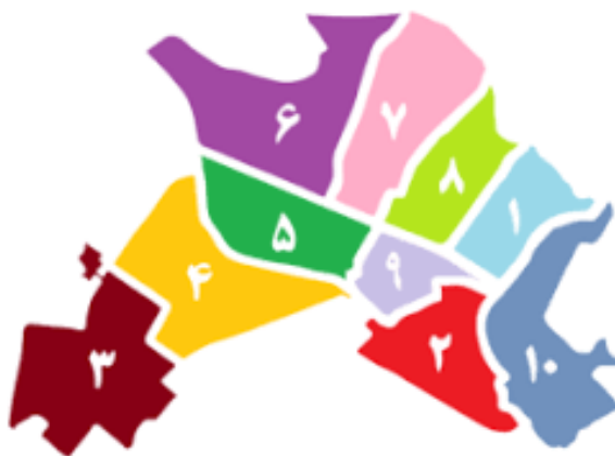
شکل ۳: تقسیم‌بندی مناطق ۱۰ گانه شهرستان کرج (منبع: سایت شهرداری کرج ۳ )

این تحقیق در مناطق ۵ و ۶ شهرداری کرج صورت گرفت منطقه پنج و شش از مهاجرپذیرترین مناطق شهرداری کرج است که قومیت‌های متعدد ایرانی در آن حضور دارند و موضوع دست‌فروش نسبت به سایر مناطق در این مناطق بیشتر به چشم می‌خورد و روزبازارها جمعه‌بازار و سه‌شنبه‌بازار در منطقه ۵ و ۶ از اصلی‌ترین روزبازارهای موجود در سطح کرج است (سایت شهرداری کرج).