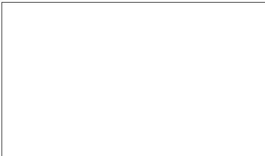
شکل ۱. نمودار نسبت کاهش پلکانی در نمونه‌های سه‌گانه