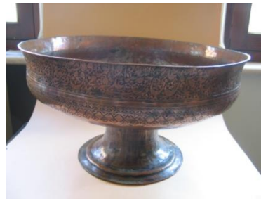
تصویر ۴- جام چهل کلید (موزه مقدم) تصویر ۵- ظرف مسی پایه دارکه دورتادور لبه آن کتیبه ای در صلوات به ائمه و... (موزه مقدم)