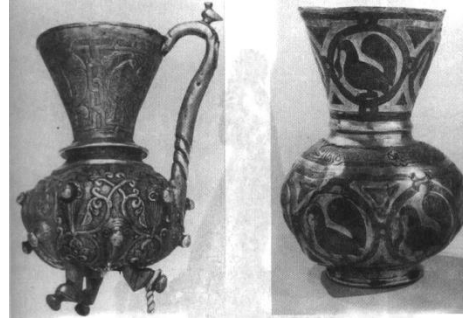
تصاویر ۱ و ۲ - گلدان احتمالا ایران- (اتینگهاوزن، ۱۳۸۱، تصاویر ۲۵۵ و ۲۵۴) تصویر ۳- پایه چراغ مسی، موزه آستان قدس رضوی (احسانی، ۱۳۶۸)