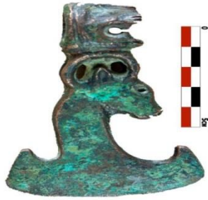
شکل ۳: تبر مفرغی موزه هرنندکرمان (حصاری، ۱۳۹۱).