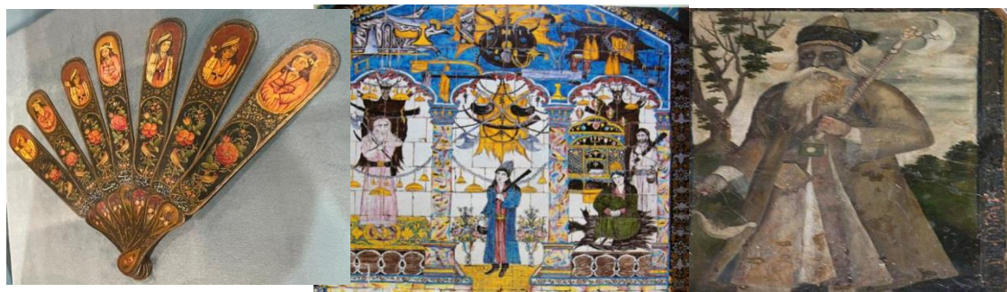
شکل ۸: نگاره درویش با تبر موزه هفت تنان شیراز، نگاره دراویش تکیه معاون الملک کرمانشاه و نقش دراویش نو آیین بر روی باد بزن موزه ملی هنر اصفهان (نگارنده، ۱۴۰۰).