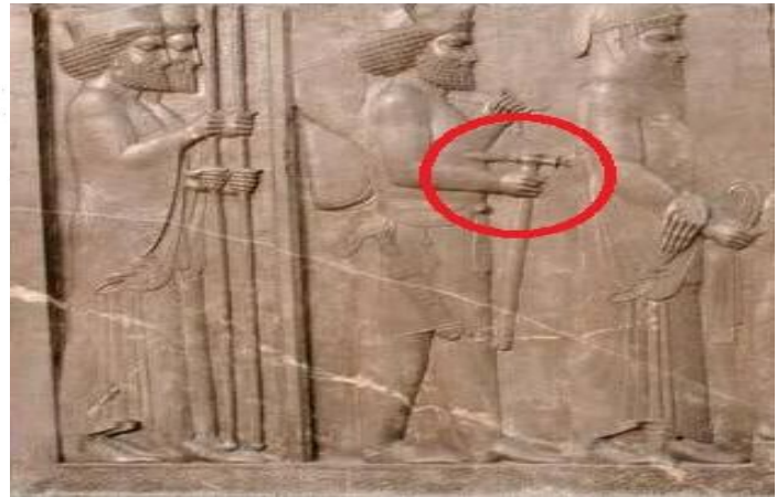
شکل ۴: تصویر تبر در نقوش برجسته تخت جمشید صحنه بارعام (موزه ملی ایران، ۱۴۰۰).