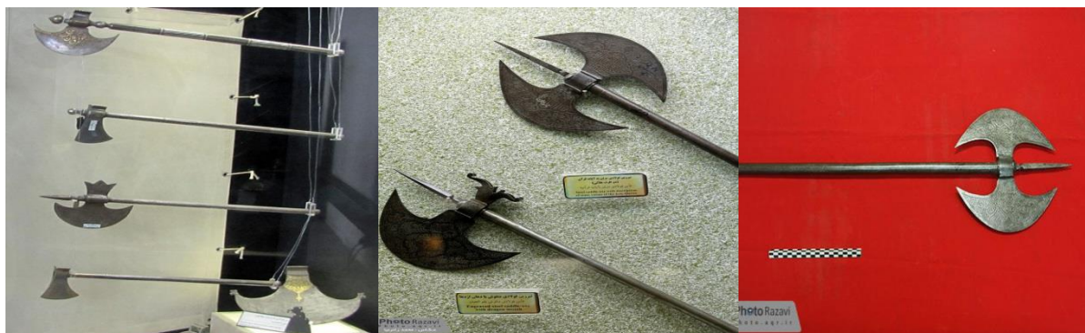
شکل ۷: تصاویر تبرزین ها از دوره های صفویه تا قاجار موزه های آستان قدس رضوی و باغ موزه نادری (نگارنده، ۱۴۰۰)