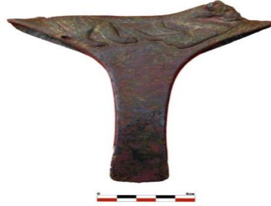
شکل ۲: تبر مفرغی موزه هرنندکرمان (حصاری، ۱۳۹۱).