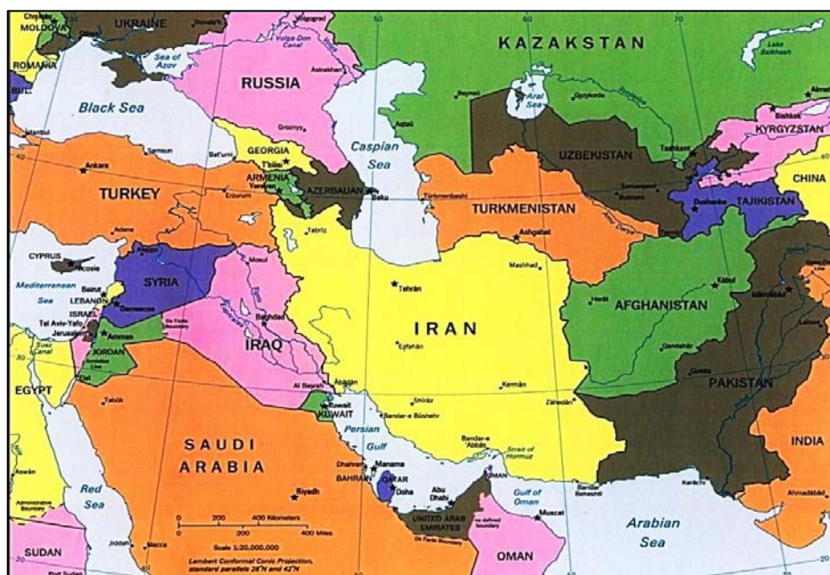
نقشه شماره ۲- جایگاه ژئواستراتژیک ایران