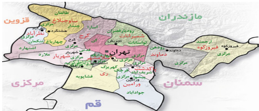
نقشه شماره (۱): شهرستان تهران

۱- موقعیت و وسعت: رباط کریم بین ۳۵ درجه و ۲۸ دقیقه عرض شمالی و طول شرقی آن از نصف النهار گرینویچ بین ۵۰ درجه و ۴۵ دقیقه غربی تا ۵۱ درجه شرقی قرار گرفته است. این منطقه با وسعتی حدود ۲۵۵ کیلومتر مربع در ارتفاع ۱۰۵۰ متری در جنوب غربی تهران واقع است و فاصله آن از تهران ۳۵ کیلومتر می‌باشد و در جنوب شهریار واقع است. حدود آن عبارت است از شمال به شهریار و از جنوب به اراضی فشاپویه و از شرق به زمین‌ها و محدوده اسلامشهر و از غرب به زرند محدود می‌شود.