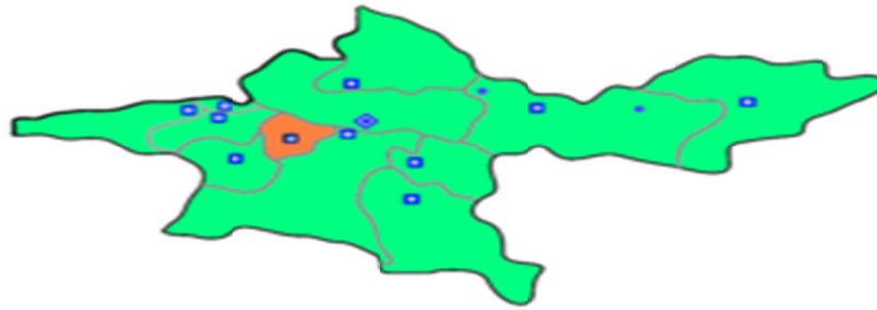
نقشه شماره (۳): شهر اسلام شهر