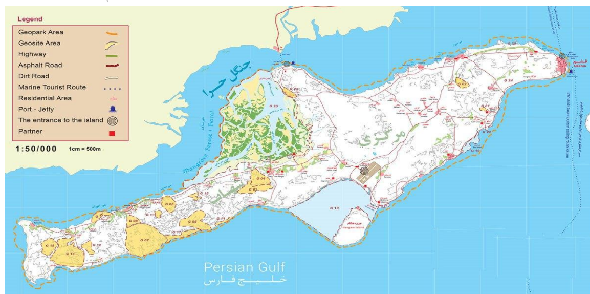
نقشه شماره ۱ جزیره قشم