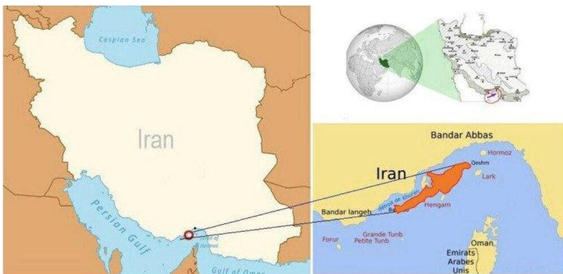
نقشه شماره ۲ موقعیت جزیره قشم