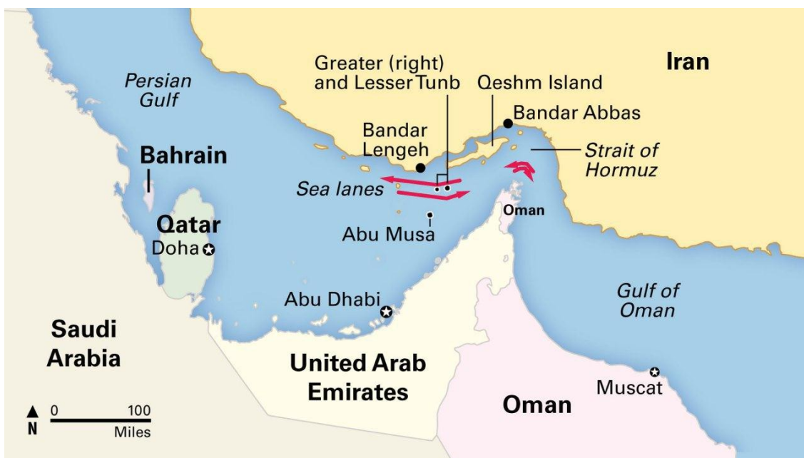
نقشه شماره ۳ موقعیت جزایر خلیج فارس

از این رو در مناطق حاشیه خلیج فارس با استفاده از این فرصت‌ها می‌توان گردشگری ورزشی را در کشور توسعه داد؛ و شناسایی راهکارهای مختلف توسعه صنعت گردشگری ورزشی و استفاده از توانمندی‌های گردشگری شهرهای ساحلی بسیار ضرورت دارد.